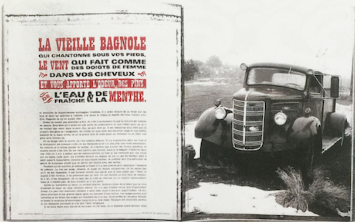
Un livre de rencontres entre les photos de Patricia de Gorostarzu et les textes de jeunes écrivains américains. Ici, la nouvelle «Lâchons les chiens», de Brady Udall.